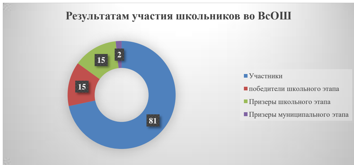
Диаграмма по результатам участия школьников во ВсОШ

В 2023 году был проанализирован объем участников конкурсных мероприятий разных уровней. Дистанционные формы работы с учащимися, создание условий для проявления их познавательной активности позволили принимать активное участие в дистанционных конкурсах регионального, всероссийского и международного уровней. Результат – положительная динамика участия в олимпиадах и конкурсах, привлечение к участию в интеллектуальных соревнованиях большего количества обучающихся Школы.